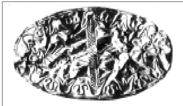
Обр. 2. Нагръдникът от Старо село до Сливен