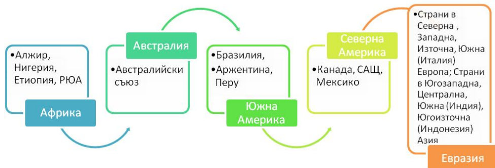
Фиг. 2. Съдържателен обхват на изучаваните континенти и страните в тях в седми клас в тематично ядро „Океани и континенти”

Във фигурата по-долу са представени континентите и страните в тях, като е оградена последователността на изучаване, съответно на континентите и страните в тях.